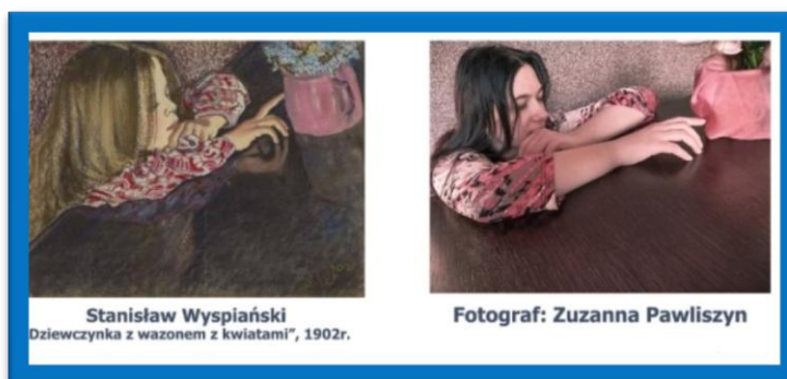
Stanisław Wyspiański „ Dziewczynka z wazonem z kwiatami”